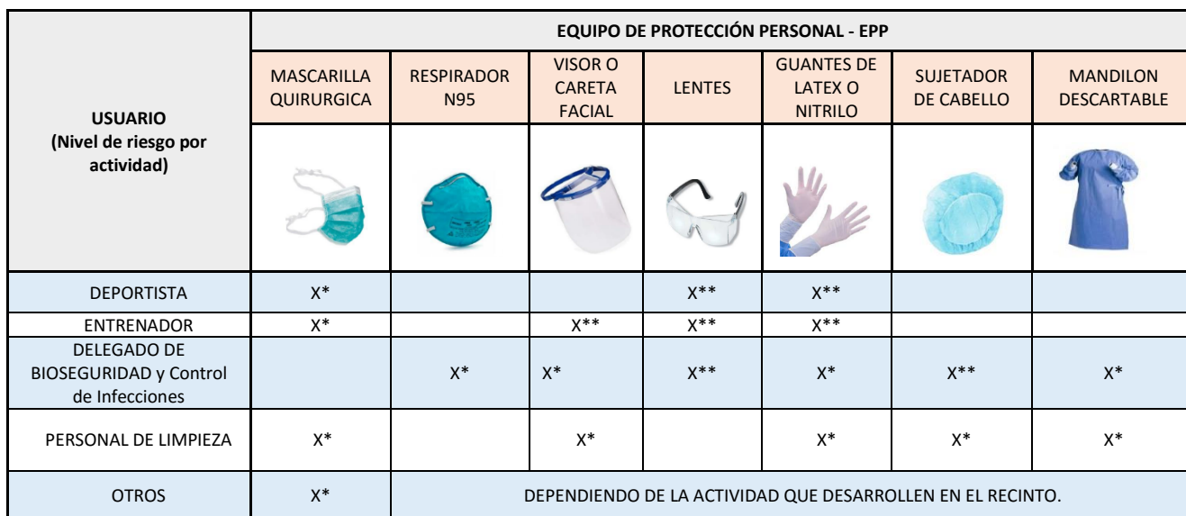
TABLA N° 05: DESCRIPCIÓN DE EPP POR TIPO DE PERSONAL